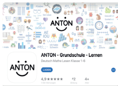
ANTON im App Store

2. Erstellen eines Nutzerkontos (für die Kinder):